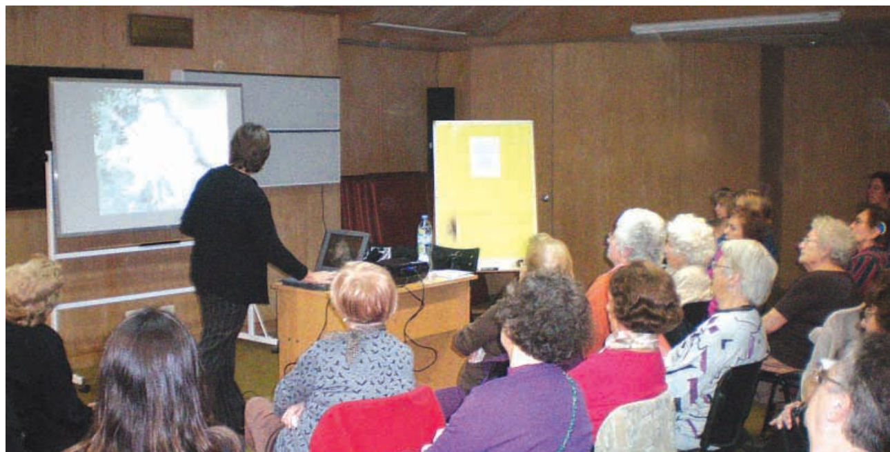
El pasado 5 de mayo durante el encuentro “Pasado, presente y futuro de una institución de salud pública”, sobre el Instituto Pasteur.