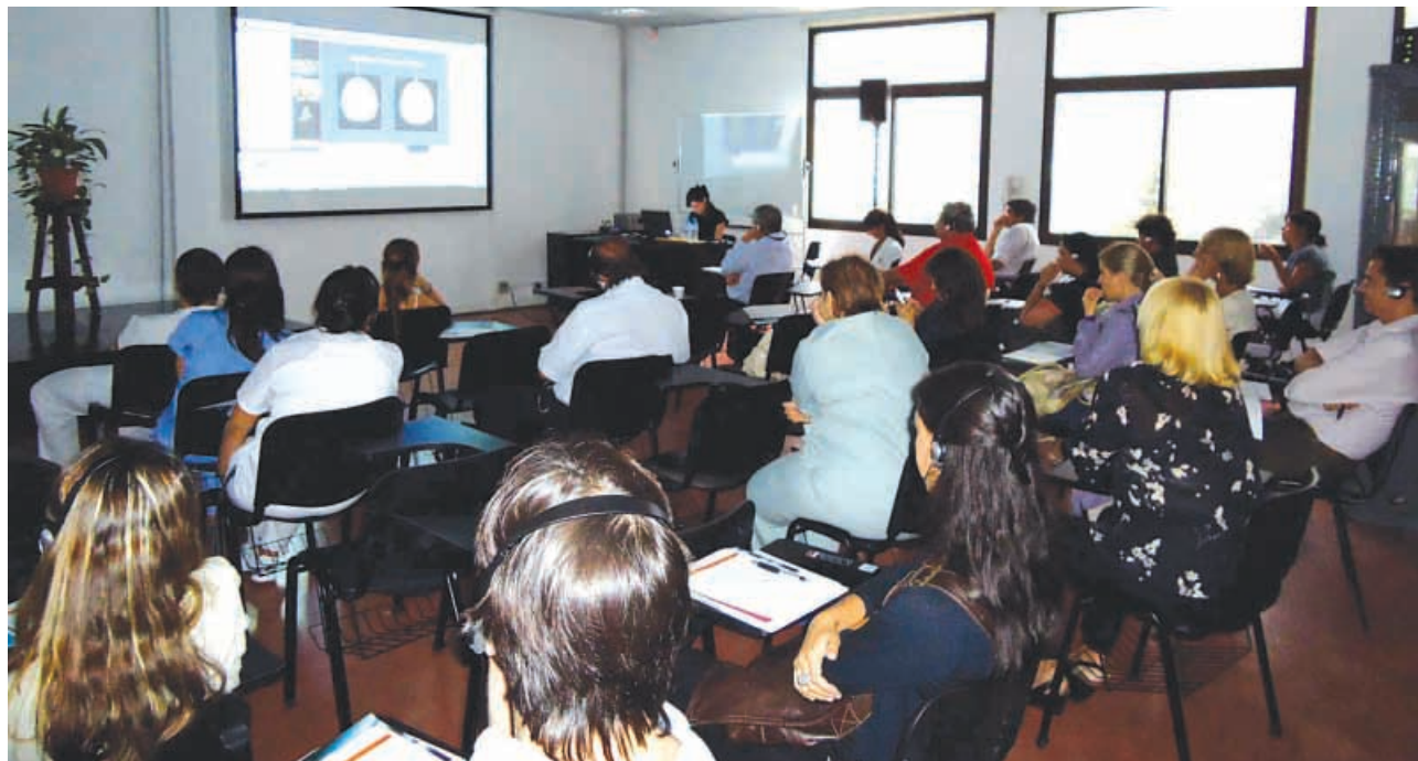
Los asistentes se capacitan durante el simposio llevado a cabo el 3 de marzo.

Durante el primer semestre del año tuvieron lugar en la Fundación Hospitalaria dos destacados simposios internacionales interactivos vía web dirigidos a profesionales especializados en la infancia de todo el país.